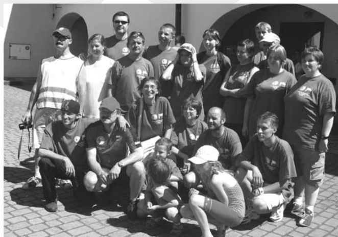
Najliczniejsza grupa rajdu - Polski Związek Głuchych