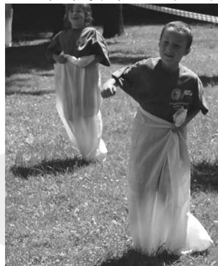
Biegi w workach