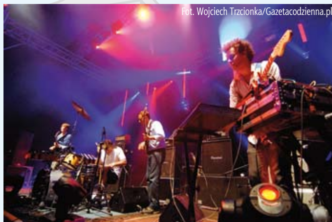
Koncert zespołu Battles