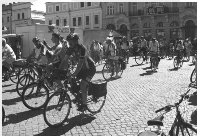
Peloton wyrusza w drogę