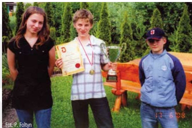
Fot. P. Foltyn

Michał będzie uczestniczył w dwóch zgrupowaniach kadry, które odbędą się kolejno w Ustroniu, w dniach 17-23 lipca, a następnie w dniach 17-23 sierpnia w Kotobrzegu.