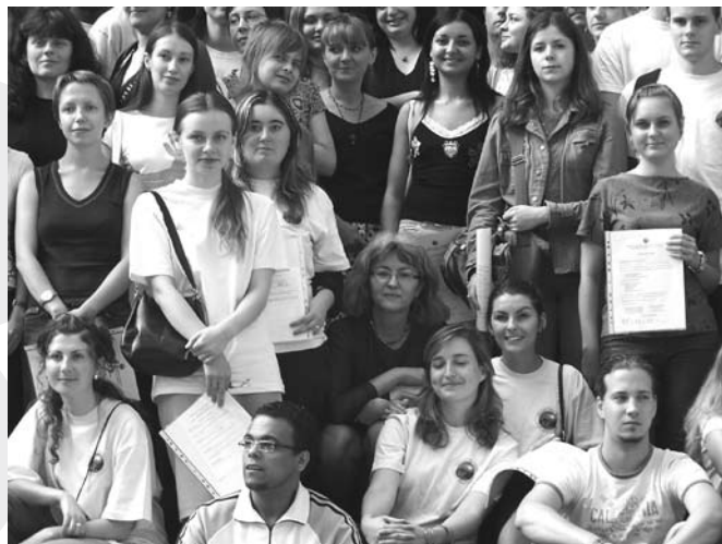
Dyrekcja SJKP w otoczeniu absolwentów ubiegłorocznej szkoły.

Piętnasty sierpnia będzie zresztą dniem wyjątkowym nie tylko dla uczestników letniej szkoły – w godzinach dopołudniowych odbędzie się „Sprawdzian z polskiego”, impreza o ogólnopolskim zasięgu przeznaczona dla wszystkich cudzoziemców, którzy chcieliby zmierzyć się z polską ortografią.